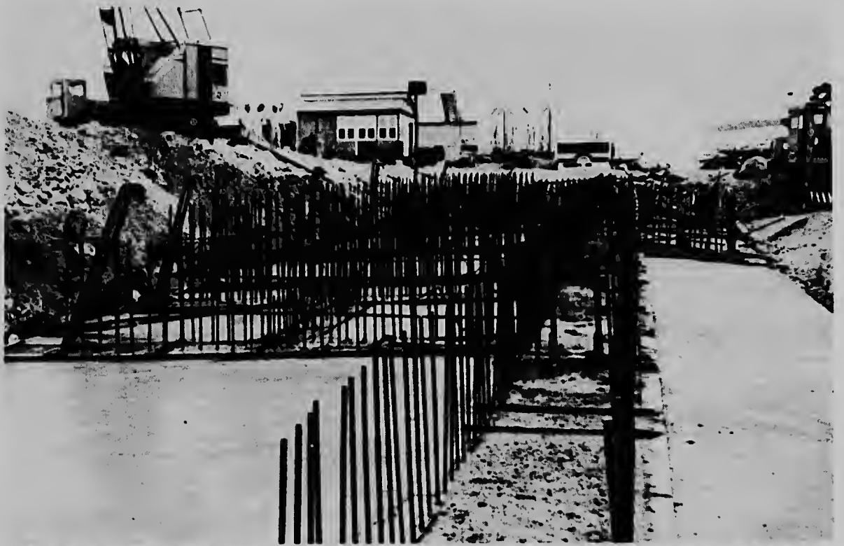
Esaki ta caminda ta bashando e beton qu tin qu forma e fundeshi di e cabes di brug na Otrabanda. E trabao aki mester bai continuamente y ta dura un dia y mei durante cual 50 trahador lo traha pa basha un cantidad inmenso di beton qu despues ora e seca lo bira un bloque masivo.

Durante e bashamentu di beton, tin mas o menos 50 persona ta traha.